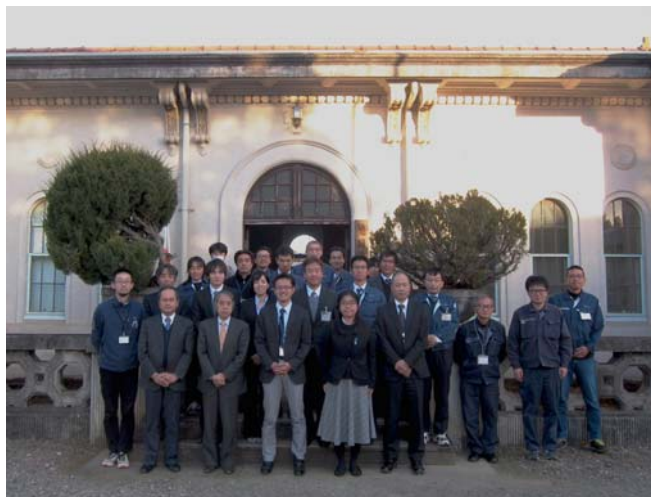
写真1 会議の参加者（本館前にて撮影）

本連絡会では、情報・意見交換及び討論を通じて関係機関相互の知見を共有することで、今後の業務の推進に役立てられるものと考えます。