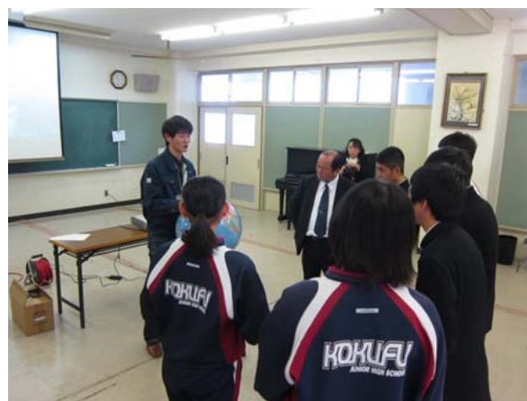
写真6 終わった後も熱心な生徒さんたちが集まりました