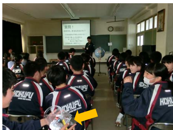
写真3 磁力線可視化装置(矢印)に触れてもらいました