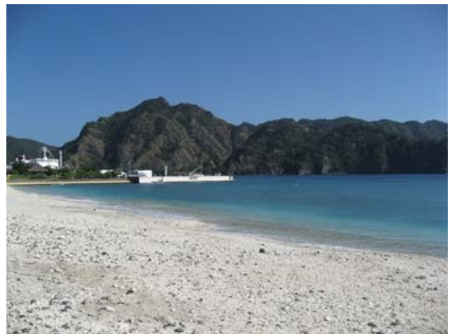
写真2 大村海岸のビーチから二見港を望む