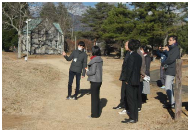
写真3 施設見学における職員の説明