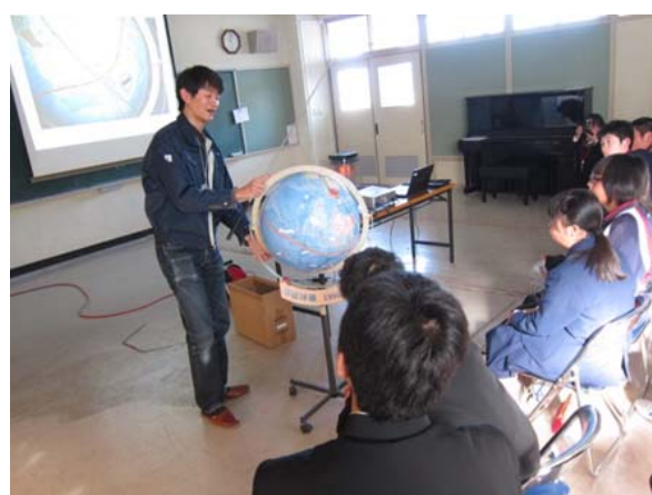
写真4 地磁気について説明を加えた地球儀を使って説明