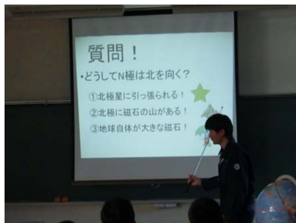
写真2 クイズ形式で進行していきます