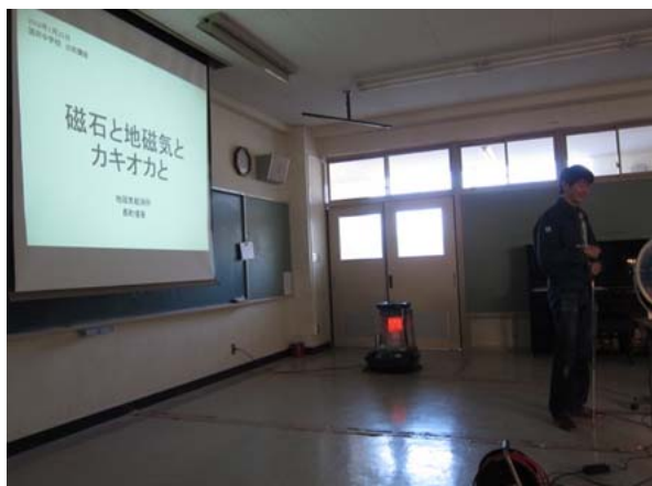
写真1 題目は「磁石と地磁気とカキオカと」