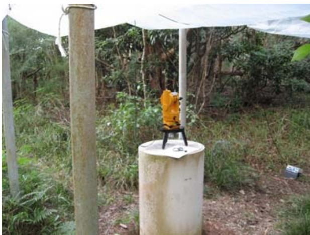
写真1 基準点とFT型磁気儀