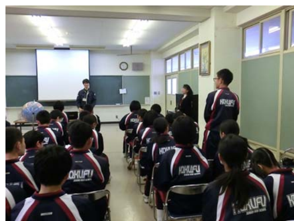
写真5 代表の生徒さんの挨拶